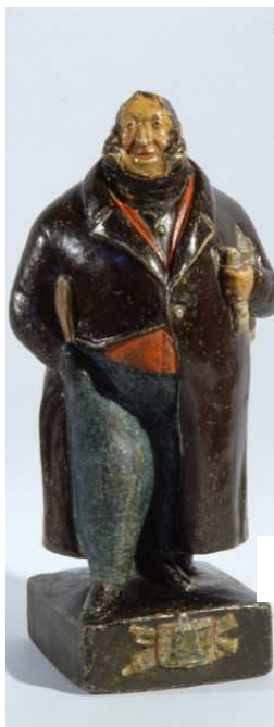
Caricatura di G. Rossini

indicando cognome e nome, n° tessera ANCeSCAO 2016 e n° libro soci del proprio Centro